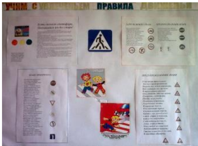
Стенгазеты по БДД